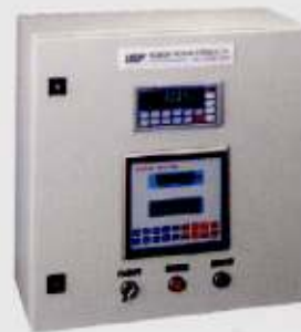
Constant feeder Controller